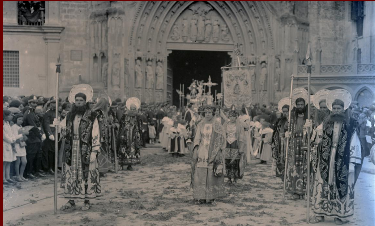
Font: Barberá Masip, Vicente Festa del Corpus de València (cap a 1925) Biblioteca Valenciana Nicolau Primitiu. Fons Desfilis