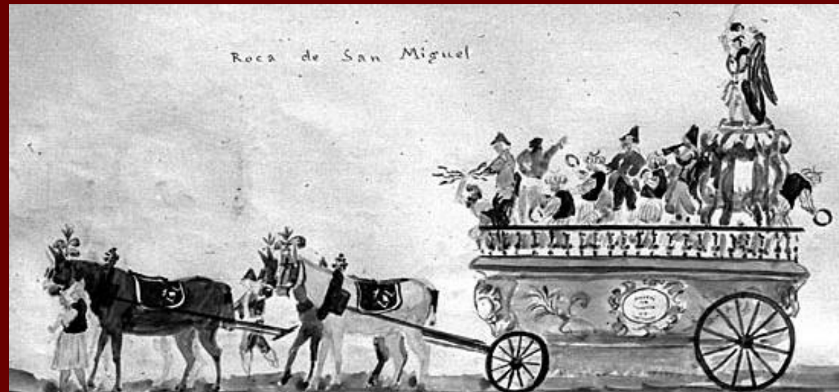
Font: Detalle del Rollo del corpus . Edición facsimilar del ejemplar del Museo de las Rocas Biblioteca Valenciana Nicolau Primitiu

El Corpus Christi de Valencia es una de las celebraciones más antiguas y emblemáticas de la ciudad. Instituida en 1326, hace 700 años, este festejo combina tradición religiosa, cultura popular y un rico patrimonio artístico que ha perdurado a lo largo de los siglos. Durante la festividad, las calles del centro histórico se llenan de vida con procesiones, danzas tradicionales y elementos únicos como las famosas “rocas”, carrozas decoradas que forman parte del desfile.