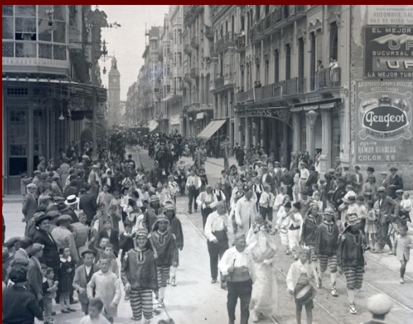
Font: Barberá Masip, Vicente Fiesta del Corpus de València (hacia 1925) Biblioteca Valenciana Nicolau Primitiu. Fons Desfilis