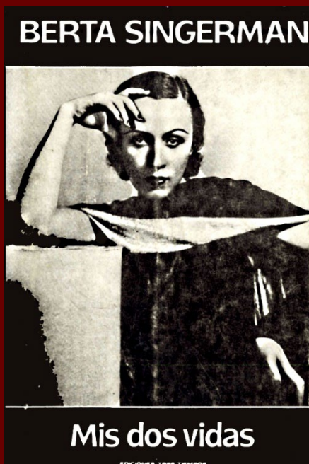
Singerman, Berta. Les meues dos vides Buenos Aires: Tres Tiempos, 1981

Berta Singerman (1903-1999) va ser una actriu i recitadora russa nacionalitzada argentina, d'enorme èxit durant el segon terç del segle XX.