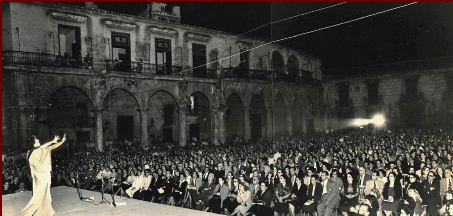
Fotografia de Berta Singerman actuant en la plaça de l'Havana l'Havana, ca. 1960

Biblioteca Valenciana Nicolau Primitiu. Fons Berta Singerman