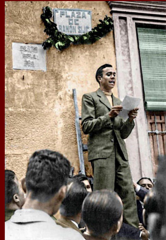
Miguel Hernández llig la elegia en honor a Ramón Sijé (1936, abril 14. Orihuela).

La Biblioteca Valenciana Nicolau Primitiu disposa d'algunes de les edicions més antigues de les seues obres. Des de 2023 estan disponibles a text complet a través de la nostra Biblioteca Valenciana Digital (BIVALDI).