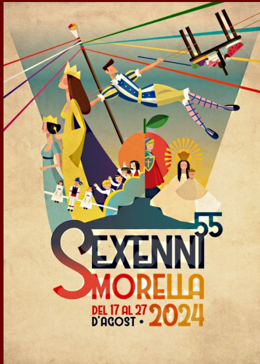
Cartel del 55 Sexenni de Morella (2024)

El 14 de febrero de 1673 las autoridades civiles de la villa de Morella, a petición del pueblo, juraron un voto a la Virgen de Vallivana en señal de agradecimiento después de librarse de la terrible peste de 1672. El voto consistía en el compromiso de celebrar un solemne novenario cada seis años en honor de la Virgen.