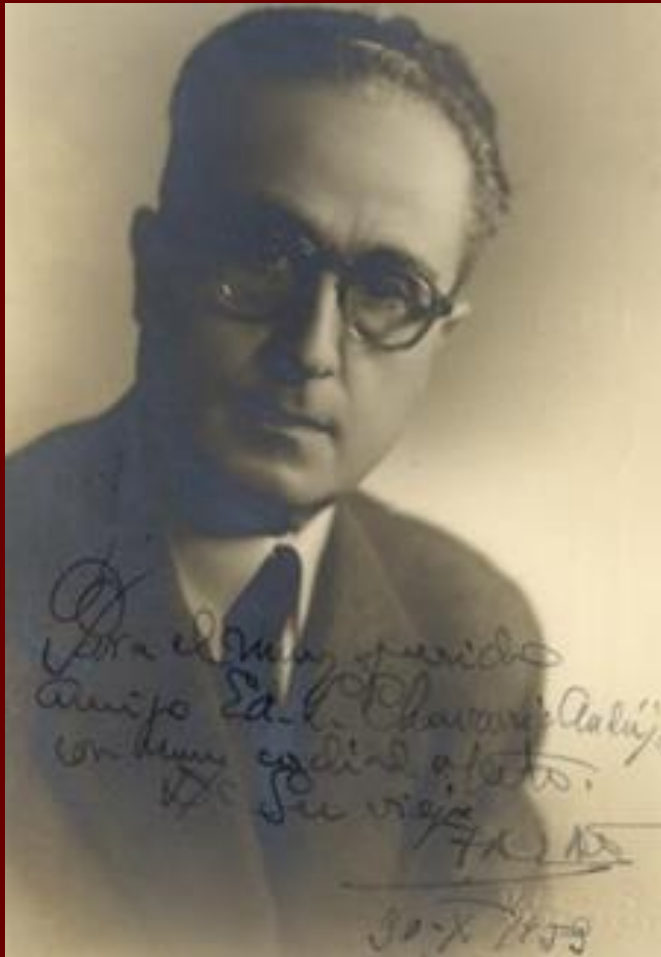
Fotografia de Manuel Palau, dedicada a Eduardo López Chavarri (1953)