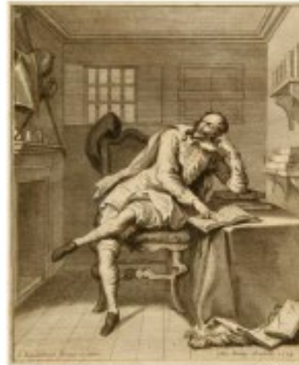
John Vanderbank, 1738