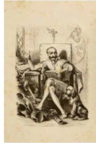
Tony Johannot, 1836