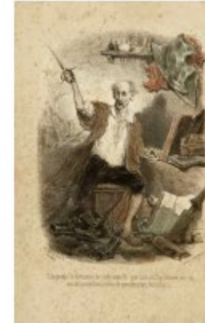
Celestino Nanteuil; 1835