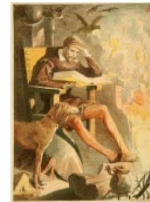
Apeles Mestres, 1879