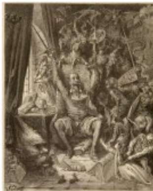
Gustav Doré, 1869