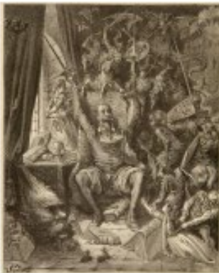
Gustav Doré, 1869