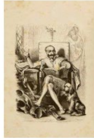
Tony Johannot, 1836