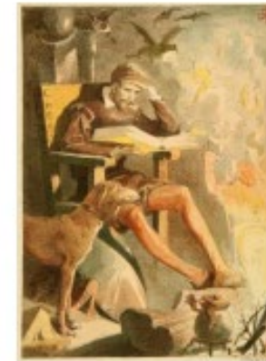
Apeles Mestres, 1879