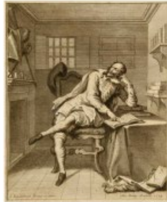
John Vanderbank, 1738