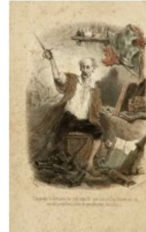
Celestino Nanteuil; 1835