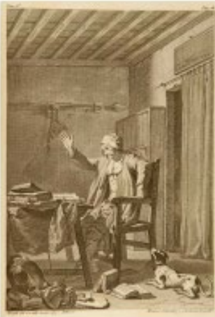
José del Castillo, 1780