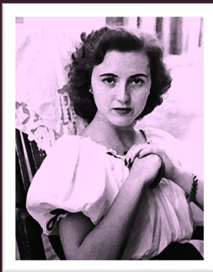
HOMENAJE A AMPARO RANCH