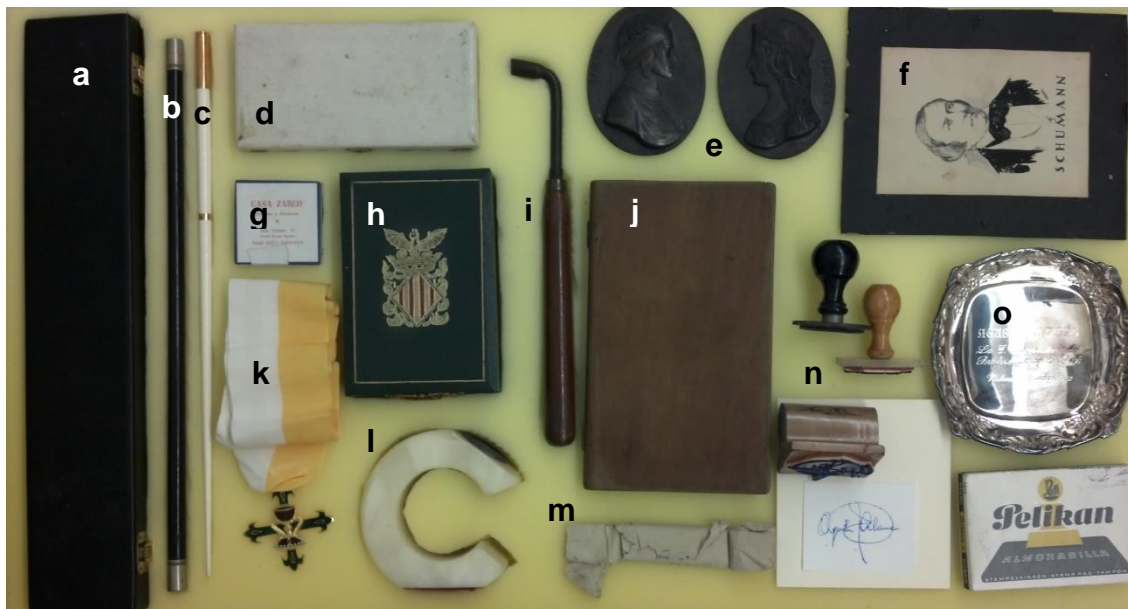
Arxiu Agustín Alamán Rodrigo